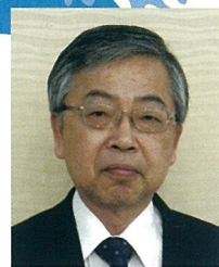
明治橋病院 病院長