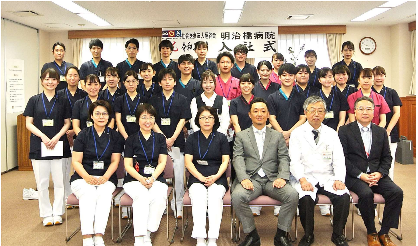
2020年度 明治橋病院入社式